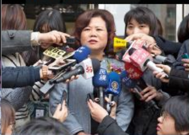
勞動部部長許銘春