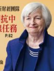
美國準財政部長 葉倫

從Fed主席到衛命進拜登新財經團隊 抗疫、抗失業到抗中 準財長葉倫火線任務 P.62